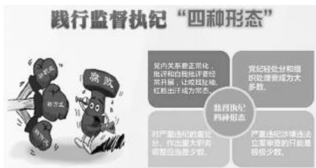
图2 监督执纪“四种形态”的合理应用

监督执纪“四种形态”提出后，国有企业一些党员领导干部对“四种形态”的认识存在误区，逐渐产生反腐败的高压态势有所减弱的错误思想，放松了警惕和对自我的要求，致使一些违规违纪问题逐渐发生。特别是部分国有企业向基层传导全面从严治党压力不够到位。同时，对于基层人员出现的违规、违纪等各类问题，并没有进行严肃的对待，精准运用“四种形态”在基层的实效效果大打折扣。