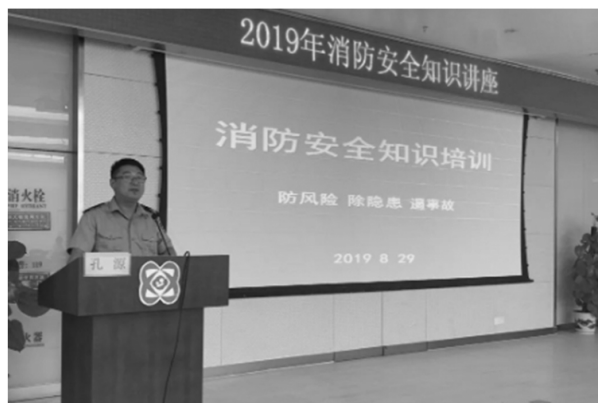
图2 开展消防安全知识培训活动

消防部门应做好火灾预防宣传工作,开展消防安全知识培训活动(见图2),充分发挥新旧媒体的舆论宣传作用,面向全社会普及消防法规、逃生自救等知识,改变以往游行队伍、发宣传单、举宣传牌等形式,创建由广播、教育、劳动等部门制度法、法制化的长效宣传机制,不断强化法人代表、企事业消防管理观念,引导其树立牢固的消防安全意识,各单位应积极承担其消防安全的责任,创建和完善自身的消防工作机制,做好火灾预防工作,转变消防监督部门大包大揽企事业消防工作的局面,使更多主体参与到消防工作中。此外,应遵循“严格执法,热情服务”要求,坚持执法为民宗旨,深化消防机构改革,不断创新消防宣教机制,使防火人员整体素质得到全面提升,以多样化方式提高工作效率,灵活配置现有人员,加大宣传力度。