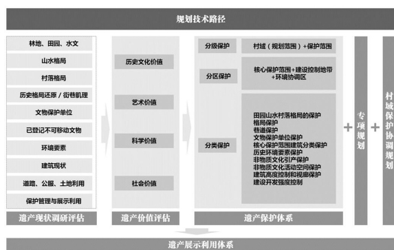
图2 名村保护规划技术路径