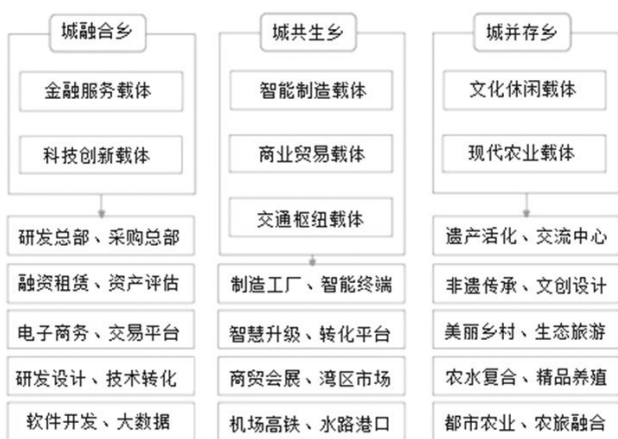
图5 城乡地区功能互补发展

地区的功能梳理和分类指导，加强创新探索实现与周边区域的协同发展。比如在城市功能组团之间的大型隔离带地区，既不能作为城市的建设空间也非典型的农村地区，该类城乡融合地区可以进行保护性开发，大量的绿色空间可以作为农业生产地区或生态空间，服务功能上又可以作为城市的大型休闲游憩郊野公园，其中的乡村地区则可以合理利用其集体建设土地和宅基地打造为休闲体验为特色的新型农村。而对一些资源禀赋较高，具有一定开发利用价值的城乡融合地区，在规划编制过程中可以适度保留一定规模的城市建设用地指标，在满足相关政策法规的前提下，结合后期具体实施过程中采用点征、点供等方式，实现功能性项目的落地，切实发挥好规划对空间资源的配置作用 9 。