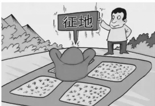
图2 耕地转化为非农业用地